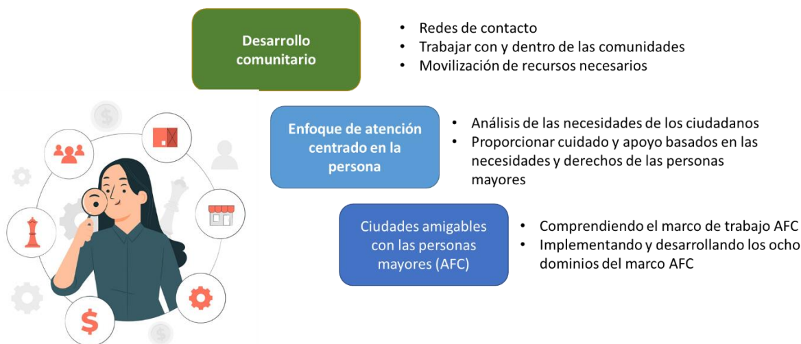
FIGURA 3: PROFESIONAL FACILITADOR DE ENTORNOS AMIGABLES CON LAS PERSONAS MAYORES

La siguiente figura presenta, a modo de resumen, los tres niveles de competencia, en términos de conocimientos, habilidades y actitudes para el desarrollo de entornos amigables con las personas mayores 2 .